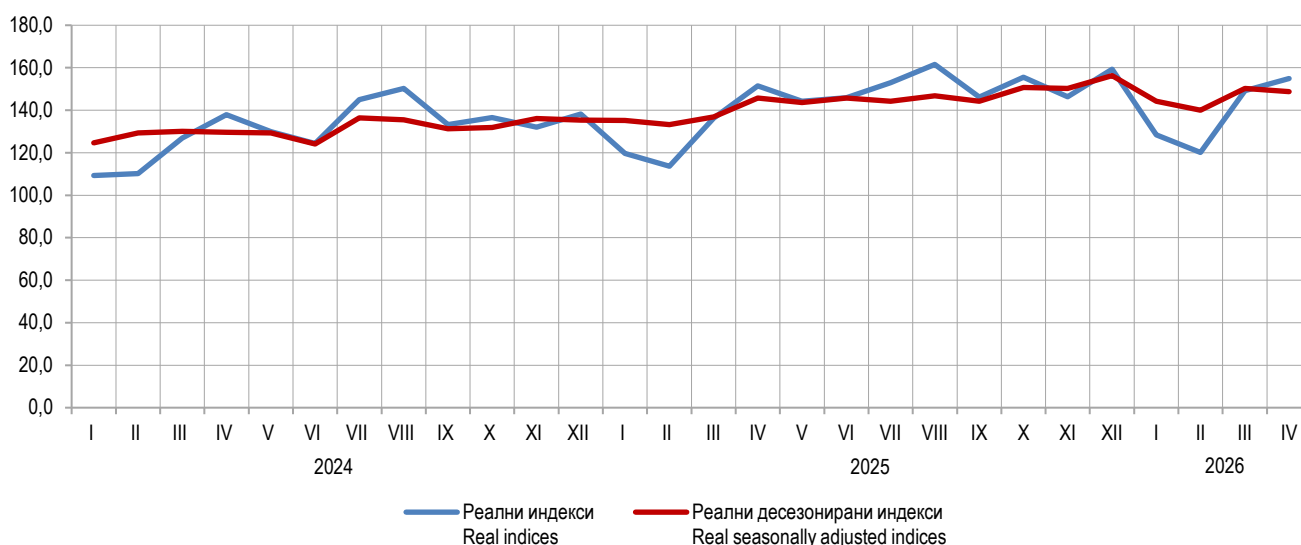
Графикон 1. Серија реалних неприлагођених и реалних десејонизираних индекса, 2021=100 Graph 1. Series of real non-adjusted and real seasonally adjusted indices, 2021=100

Turnover refers to the value of goods sold and services performed during the reference month. Turnover does not include value added tax (VAT).