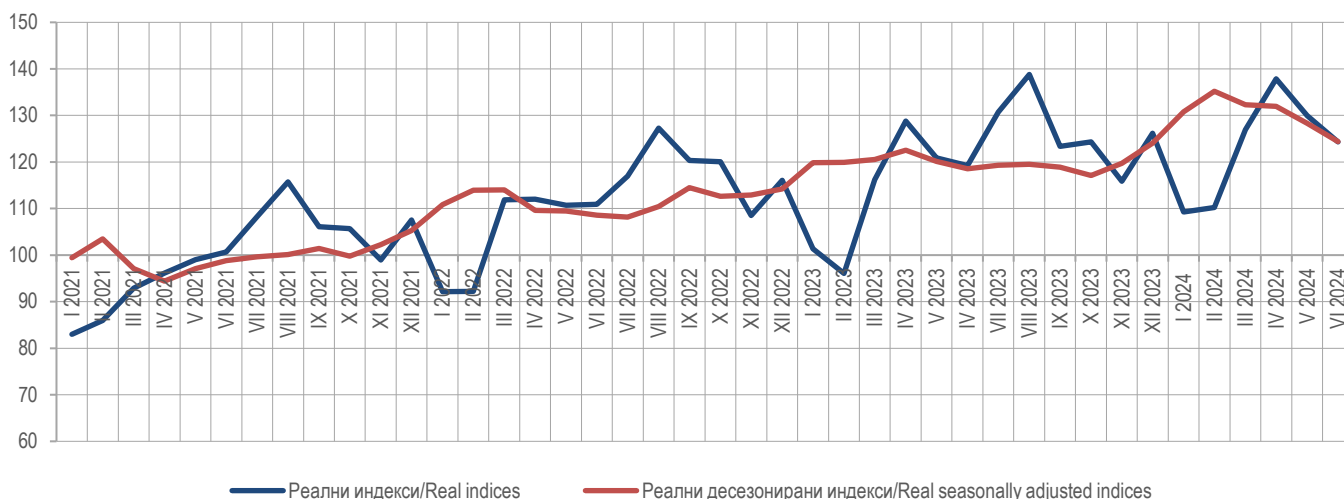
Графикон 1. Серија реалних неприлагођених и реалних десезонираних индекса, 2021=100 Graph 1. Series of real non-adjusted and real seasonally adjusted indices, 2021=100

Turnover refers to the value of goods sold and services performed during the reference month. Turnover does not include value added tax (VAT).