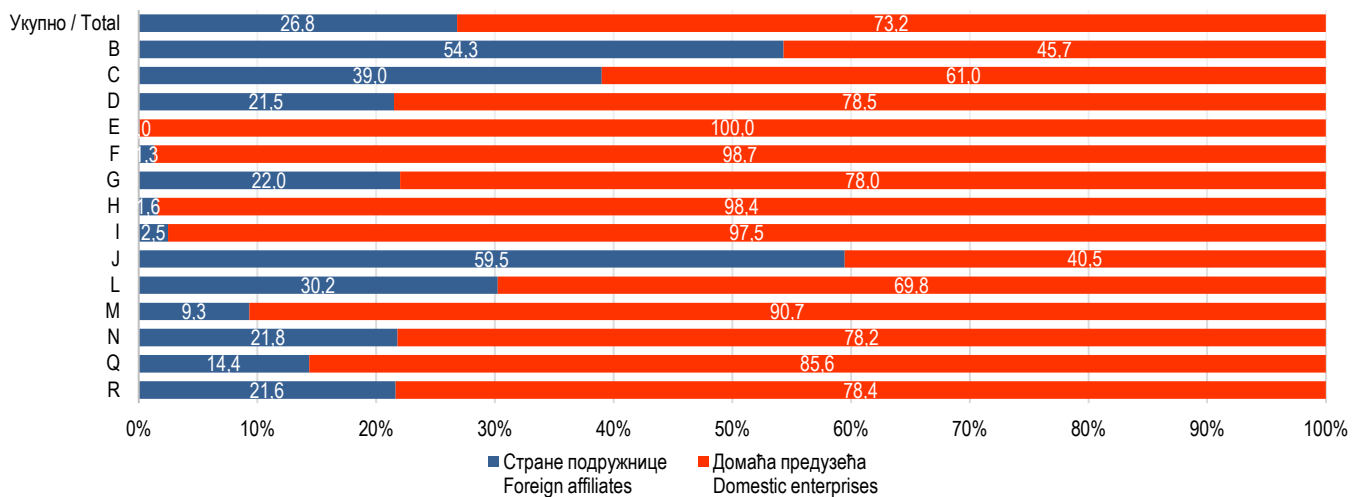
Графикон 2. Учешће страних подружница у укупној додатој вриједности подручја дјелатности, 2022. Graph 2. Share of foreign affiliates in the total value added of sections of economic activities, 2022