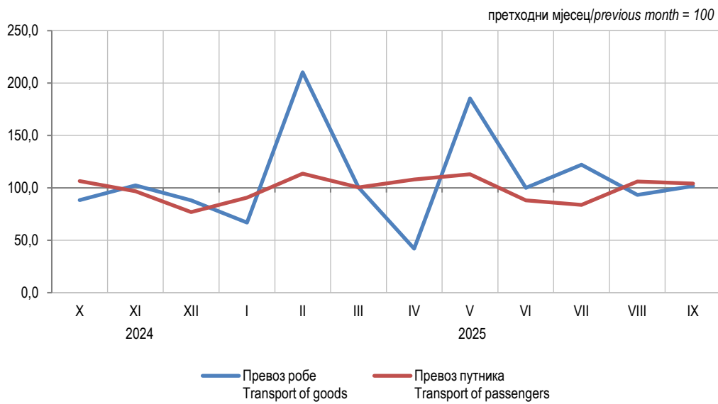
Графикон 2. Мјесечни индекси превоза робе и путника у жељезничком саобраћају Graph 2. Monthly indices of railway transport of goods and passengers