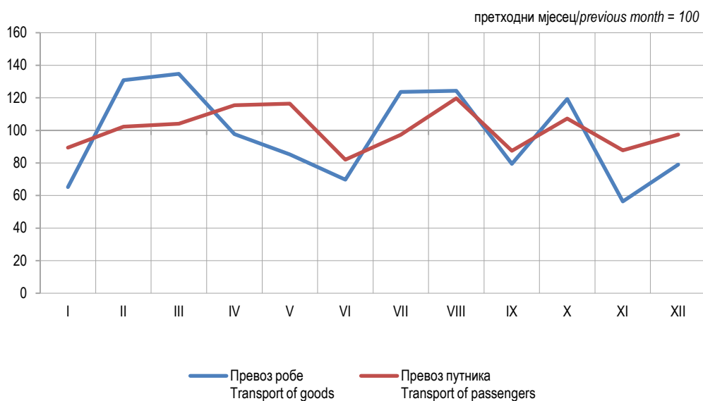
Графикон 2. Мјесечни индекси превоза робе и путника у жељезничком саобраћају, 2023. Graph 2. Monthly indices of railway transport of goods and passengers, 2023