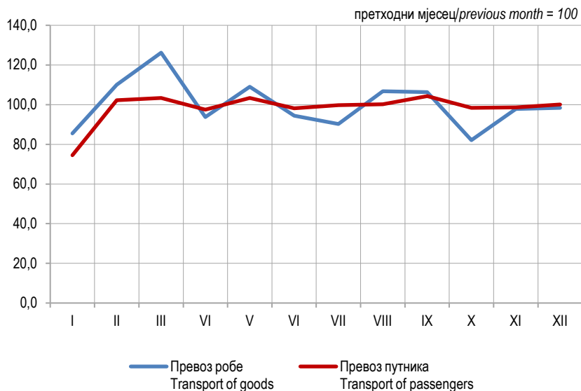
Графикон 1. Мјесечни индекси превоза робе и путника у друмском саобраћају, 2023. Graph 1. Monthly indices of road transport of goods and passengers, 2023