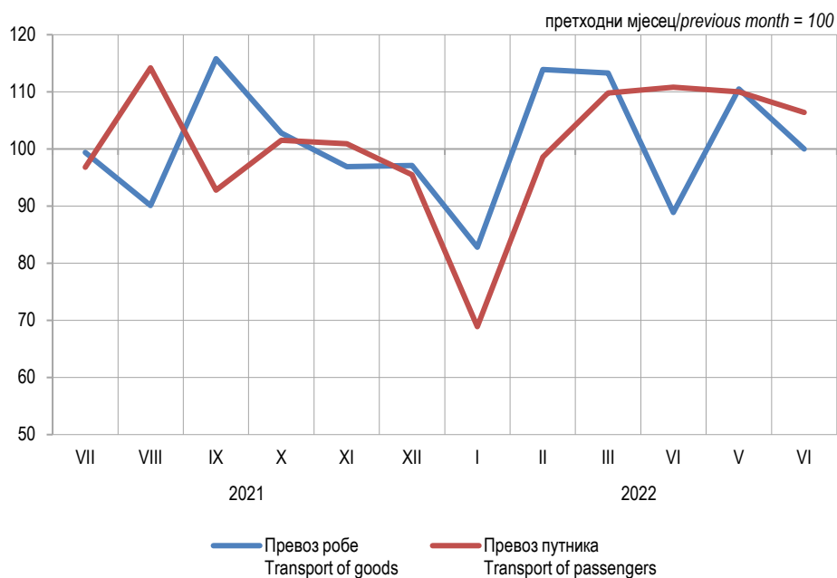
Графикон 1. Мјесечни индекси превоза робе и путника у друмском саобраћају, 2022. Graph 1. Monthly indices of road transport of goods and passengers, 2022