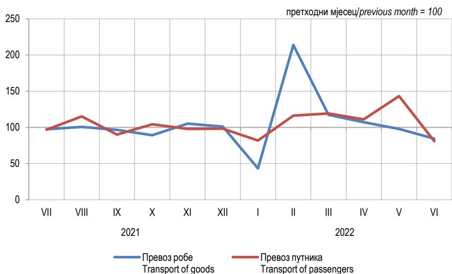
Графикон 2. Мјесечни индекси превоза робе и путника у жељезничком саобраћају, 2022. Graph 2. Monthly indices of railway transport of goods and passengers, 2022