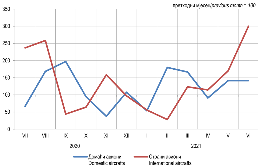
Графикон 3. Мјесечни индекси промета путника на аеродромима Републике Српске. Graph 3. Monthly indices of passenger traffic at airports of Republika Srpska

2) Индекс већи од 500 Index higher than 500