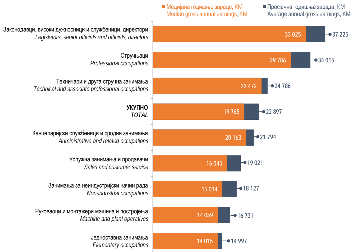
Графикон 2. Годишња зарада према групама занимања, 2022. Graph 2. Annual earnings by group of occupations, 2022