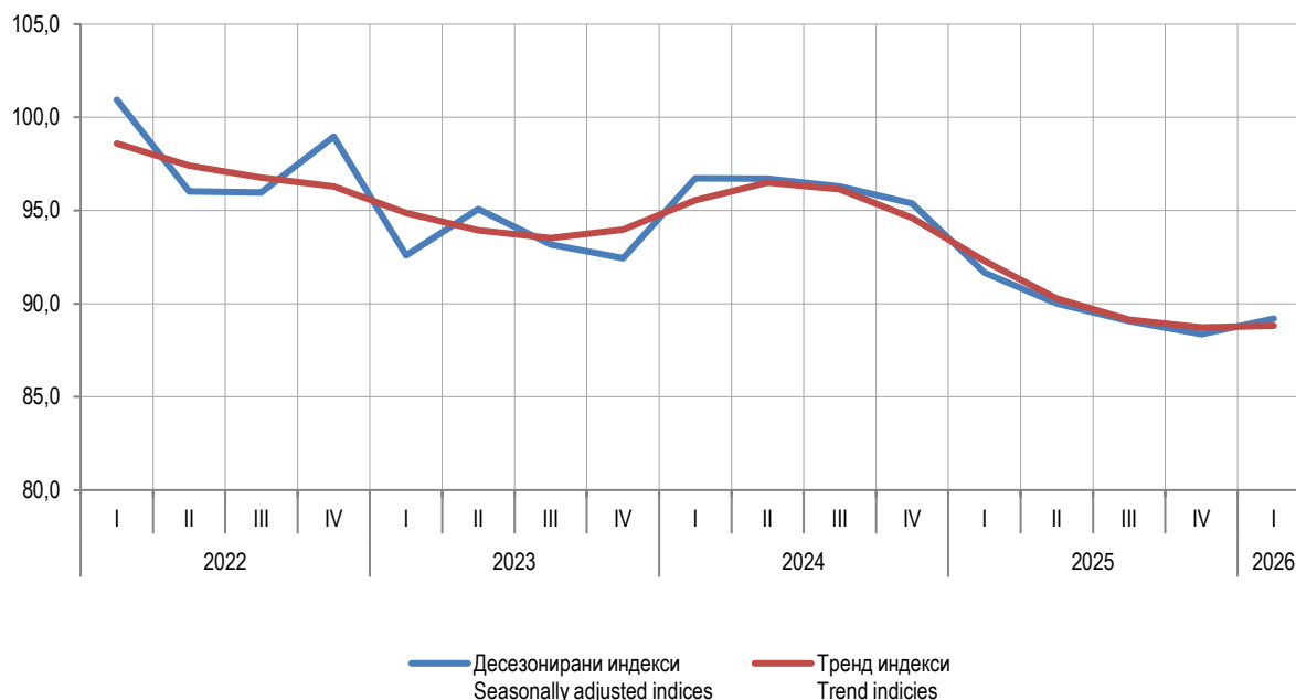
Графикон 1. Индекси производње у грађевинарству, I тромјесеље 2022 – I тромјесеље 2026. Graph 1. Indices of production in construction, 1 st quarter 2022 – 1 st quarter 2026