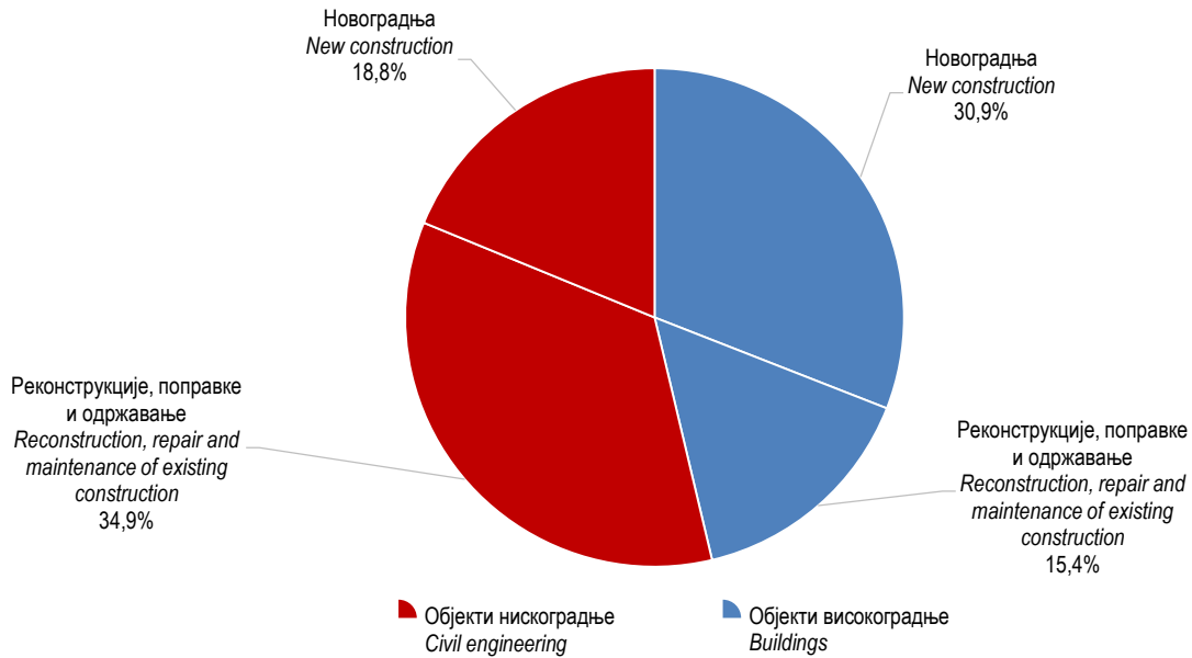
Графикон 2. Структура извршених ефективних часова према врсти радова, IV тромјесечје 2015. Graph 2. Composition of performed effective hours by type of work, 4 th quarter 2015