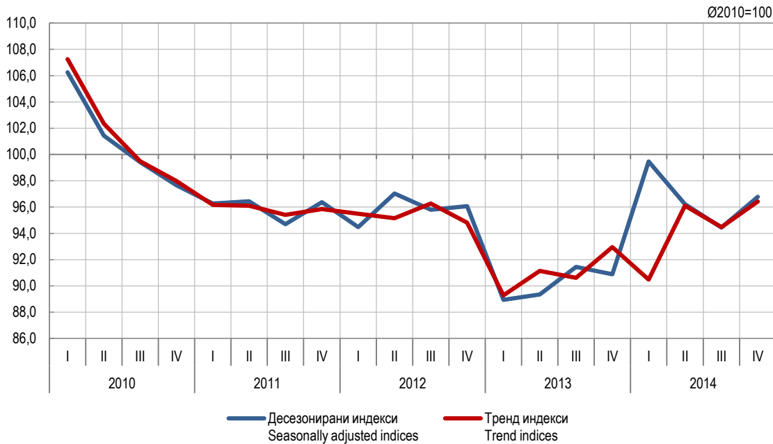
Графикон 1. Индекси производње у грађевинарству, I 2010 – IV 2014. (Ø2010=100) Graph 1. Indices of production in construction, 1 st quarter 2010 – 4 th quarter 2014 (Ø2010=100)