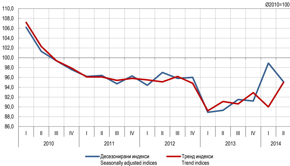
Графикон 1. Индекси производње у грађевинарству, I 2010 – II 2014 (Ø2010=100) Graph 1. Indices of production in construction, 1 st quarter 2010 – 2 nd quarter 2014 (Ø2010=100)