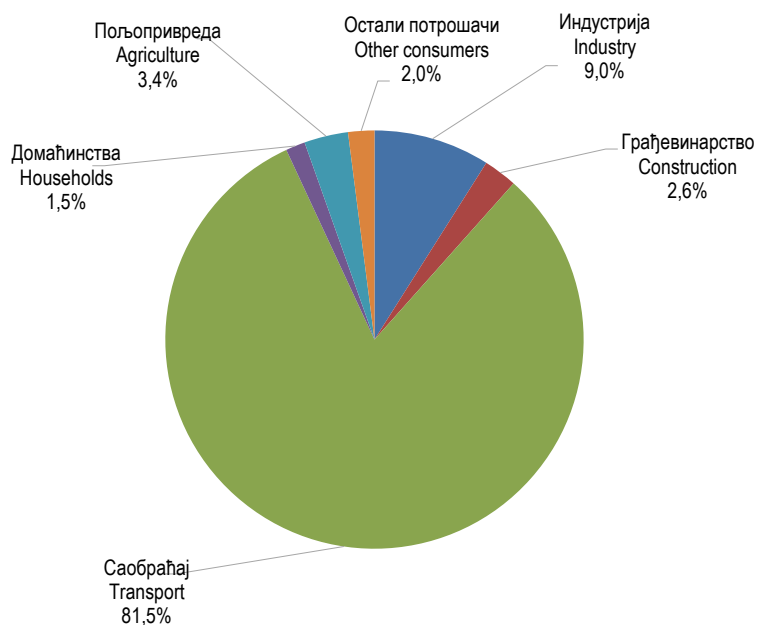
Графикон 2. Финална енергетска потрошња деривата нафте, 2019. Graph 1. Final energy consumption of petroleum products, 2019