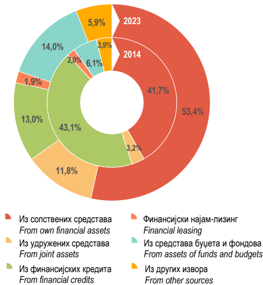
Г-11.3. Исплате за инвестиције по основним изворима финансирања у 2014. и 2023. Financing of investments by main sources in 2014 and 2023