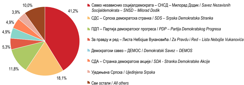
Г-3.2. Резултати избора за Представнички дом БиХ са територије Републике Српске, избори 2022 (процент добијених гласова) Election results for the House of Representatives of BH from the territory of Republika Srpska, elections 2022 (percentage of votes won)