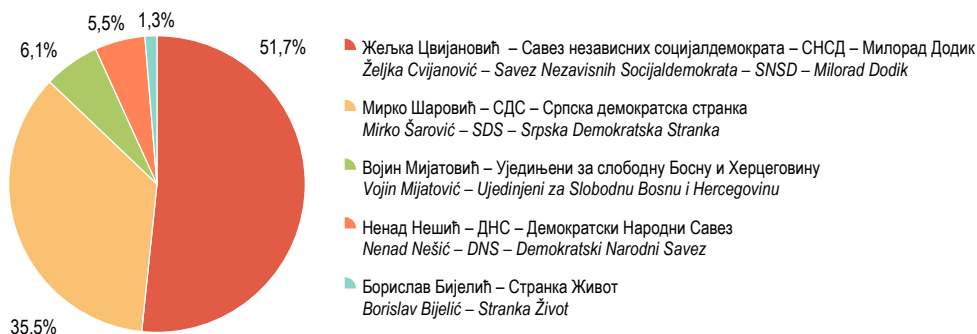
Г-3.1. Резултати избора за српског члана Предсједништва БиХ, избори 2022 (процент добијених гласова) Election results for Serbian member of Presidency of BH, elections 2022 (percentage of votes won)