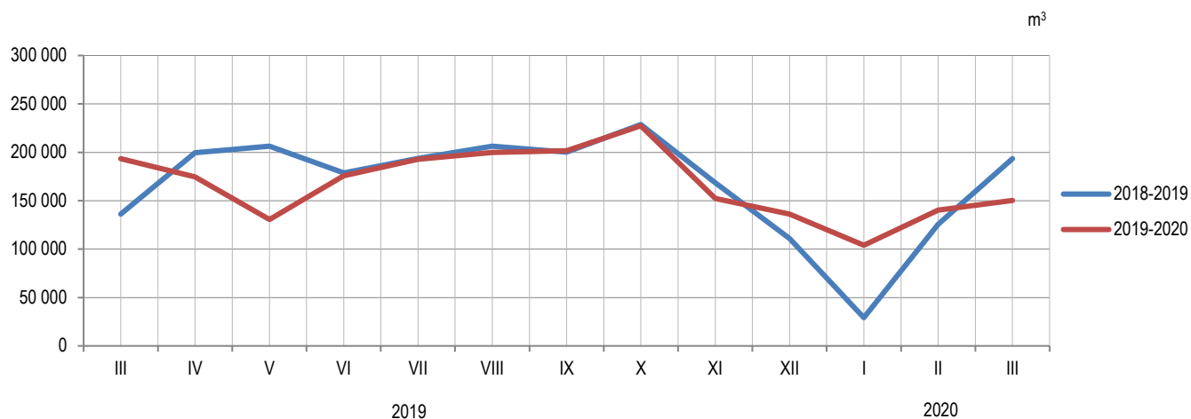
Графикон 1. Производња шумских сортимената у државним шумама по мјесецима Graph 1. Production of forest assortments in state forests by month